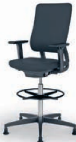
Arbeitsplatz-Counter Siège de travail haut