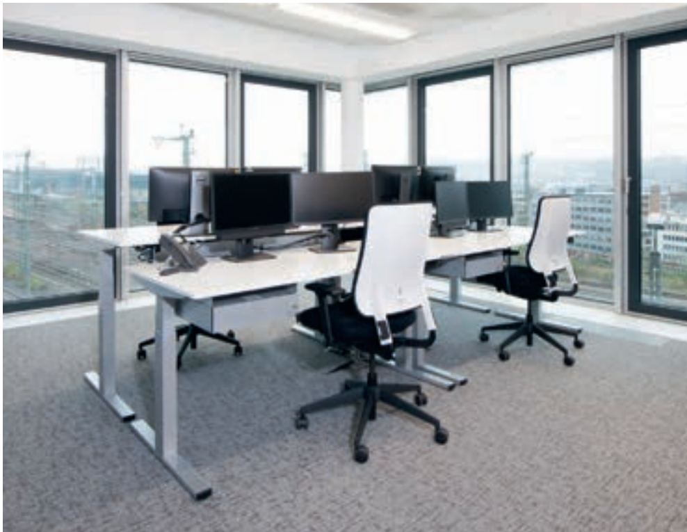
IKK Südwest Saarbrücken