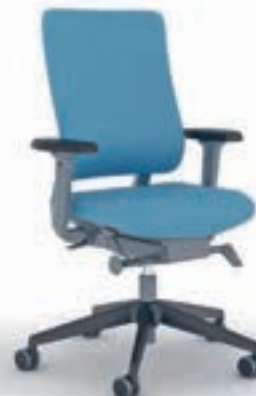
NPR-Stuhl Siège de travail NPR