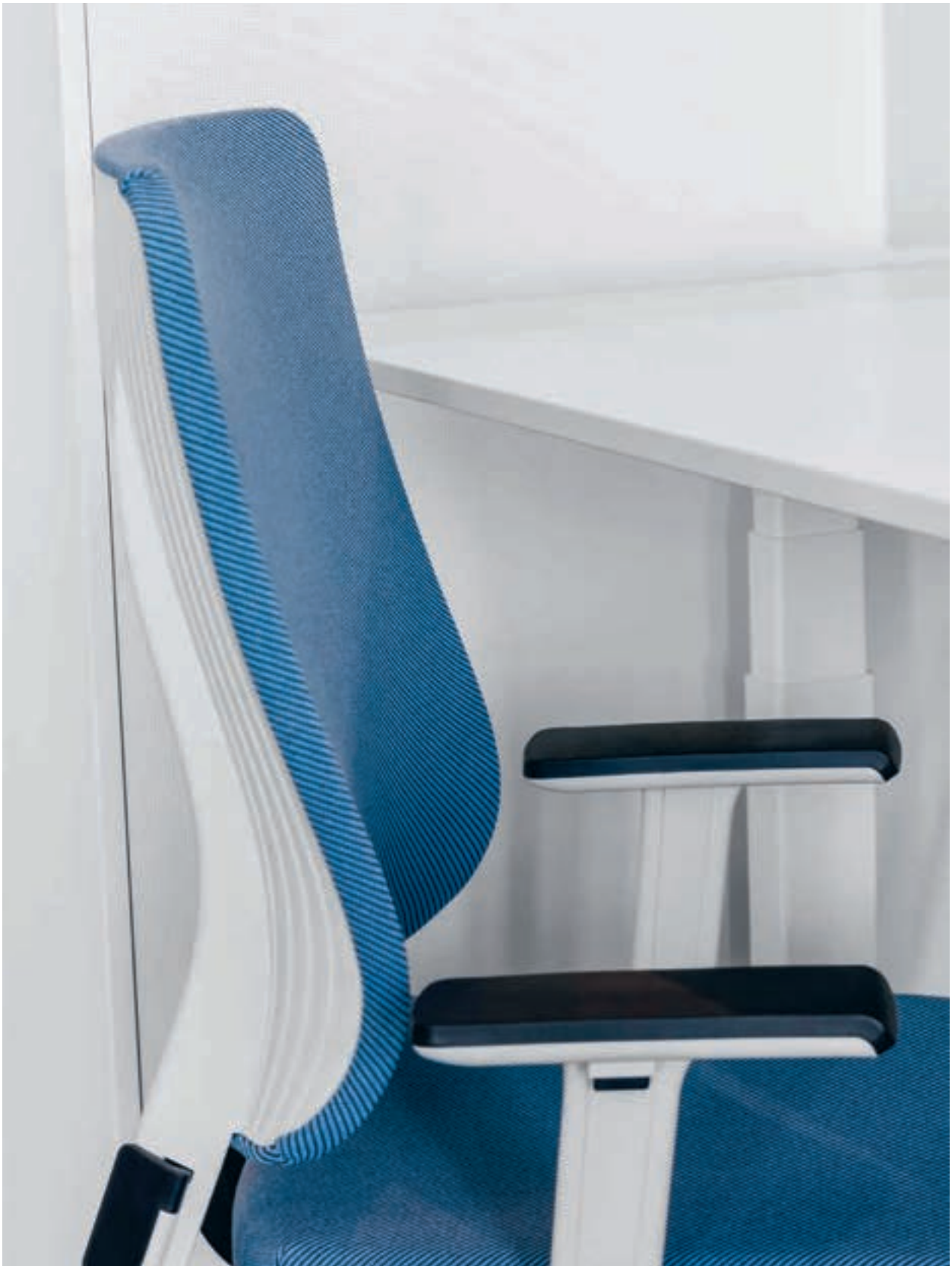
Cube, Deutsche Bahn Berlin