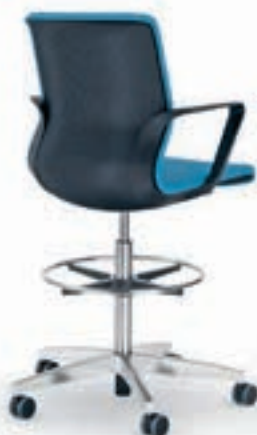
Konferenz-Counter Siège conférence haut