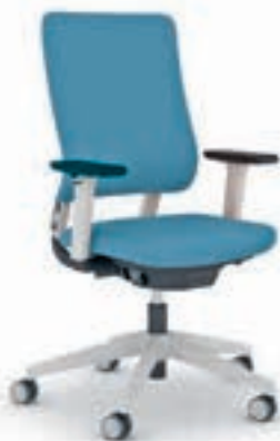
Arbeitsplatzstuhl Siège de travail

La gamme Drumback est particulièrement étendue et repose sur un même concept fort de design. Outre le siège de travail, elle propose différents types de sièges visiteurs, un siège pivotant de conférence et même un siège haut pour le bar. Une version NPR du siège de travail s'adresse aux personnes de particulièrement petites et grandes tailles grâce à une course de réglages étendue. C'est la solution d'assise idéale pour les postes de travail partagé.